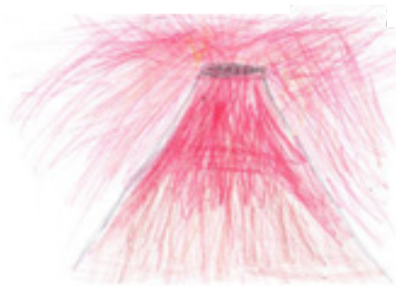
2. Vulkanausbruch auf La Palma