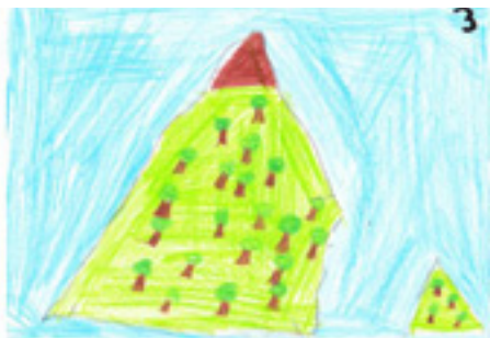
3. Abbruch der Gesteinsbrocken