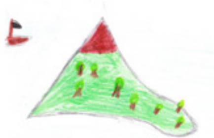
1. Insel La Palma