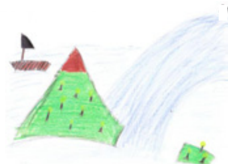
4. Entstehung der Riesenwelle